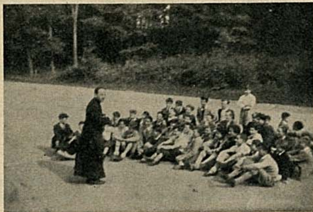
Fin de journée : derniers conseils du « Père »

De tout cœur, merci à tous ceux qui, avec nous, jour après jour, tout au long de cette année, par leurs judicieux conseils et leur inlassable dévouement, ont écrit, dans le ciel de notre âme, ces pages émouvantes de cette « légende dorée », vécue aux « Ormes ».